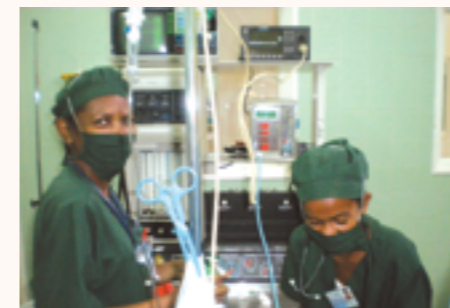
consommables en utilisation

Service Urgence, hygiène hospitalier et laboratoire : 3 matelas d'urgence, 1 mannequin de formation d'urgence, potences, divers consommables