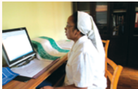
la Sœur Comptable travaillant sur son ordinateur

■ ADS ■ NC ■ N° 03/15 du 26/01/15, 18/15 du 30/03/15 et 63/15 du 27/08/15