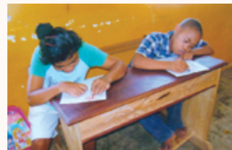
les élèves pendant le cours des arts

Créé en juin 2011, ce centre situé à Mahajanga, sur la côte Ouest a pour vocation de promouvoir le droit à l'éducation des enfants atteints de handicap mental par le biais d'une éducation spécialisée en vue de leur intégration socio-éducative et la protection de leurs droits. Il est à noter que c'est le seul établissement d'accueil d'enfants en situation de handicap mental dans la Région de Mahajanga et compte actuellement 18 enfants.