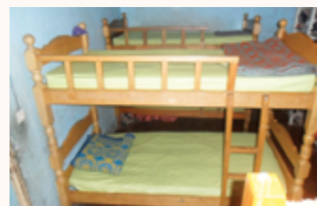
les lits et les nouveaux draps

■ N° 65/15 du 13/08/15 et 81/16 du 20/10/15