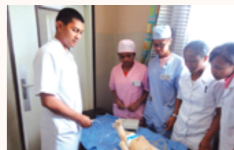
formation d'urgence sur un mannequin