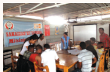
réunion pour une mise au point avec les travailleurs sociaux

Le Consulat a collaboré pour la première fois avec cette association en 2013 sur le volet « santé » en remettant un fauteuil dentaire que l'association a installé au quartier des mineurs de la maison centrale d'Antanimora, dans la capitale.