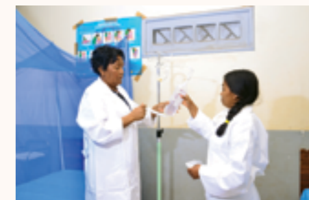
une potence en utilisation