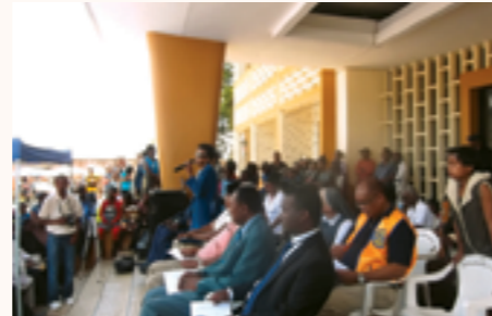
Plaidoyer en faveur de l'emploi des PNM lors de la célébration de la Journée Mondiale de la Canne Blanche à Fianarantsoa

Le projet de la Fédération des Associations d'Aveugles de Madagascar, VOATRA ASA, vise l'amélioration de l'intégration des personnes non et malvoyantes (PNM) dans le monde socioprofessionnel. L'objectif de la phase I du projet, qui fait l'objet d'un financement de la Principauté de Monaco, est de préparer cette intégration en développant la connaissance de l'offre et de la demande en matière d'emploi des personnes non et malvoyantes dans 3 régions pilotes : Vakinankaratra, Haute Matsiatra et Atsimo Andrefana. Pour ce faire, un site internet a été créé ainsi qu'un film documentaire tourné dans les 3 régions d'intervention. Près de 479 PNM ont été recensés dans les districts du projet, un travail d'identification de potentiels employeurs, d'écoles ou de centres de formation pouvant accueillir des PNM a été fait et un plaidoyer a été mené auprès de ses structures pour l'application du droit en matière d'emploi des personnes en situation de handicap.