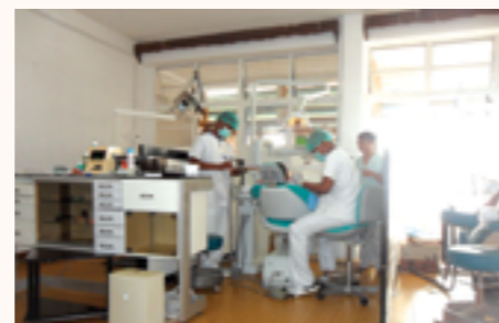
le cabinet dentaire complet en fonction

Pour atteindre les normes prescrites par l'OMS, il leur a été remis : un cabinet dentaire complet avec radio numérique, compresseur, stérilisateur, meubles à tiroirs et des fauteuils pour salle d'attente.