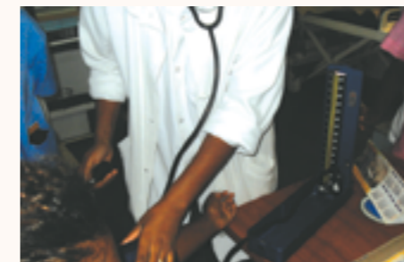
un tensiomètre en utilisation