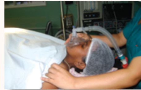
les consommables utilisés en salle d'opération