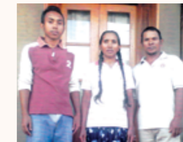
quelques parents et étudiants attributaires