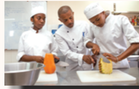
Cours de cuisine pour les apprentis cuisiniers