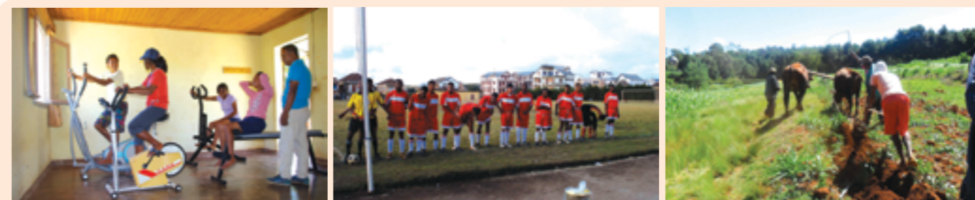
la salle de sport équipée des matériels dotés

■ ADS ■ NC ■ N° 13/15 du 31/03/15 et 59/15 du 18/09/15