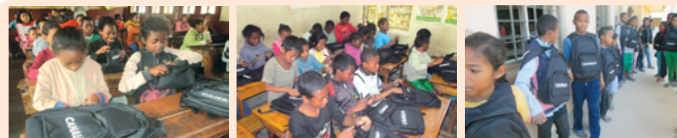
les élèves heureux d'avoir reçu les kits scolaires

■ CANAL+ Madagascar ■ NC ■ N° 84/15 du 05/11/15 et N° 85/15 du 06/11/15