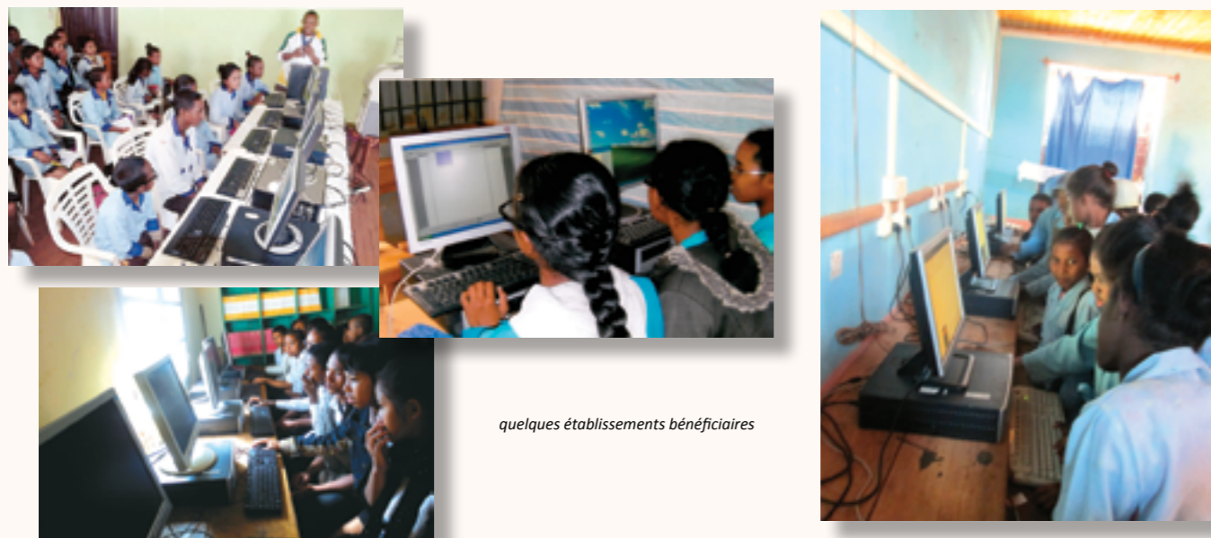
quelques établissements bénéficiaires