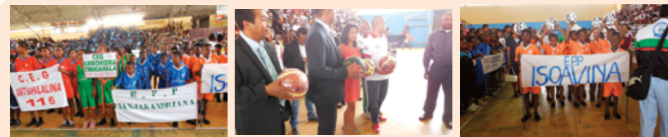
lors de la remise officielle des équipements au stade couvert de Mahamasina avec SEM le Ministre de l'Education Nationale et Mme Le Vice-Consul de Monaco