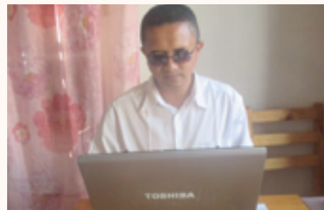
l'ordinateur acheté grâce à la subvention

Une contribution financière a été allouée à la Fédération afin de participer à l'acquisition du matériel informatique de la Fédération.