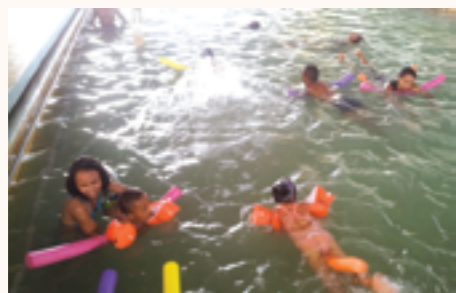
les apprentis avec les matériels à Betafo