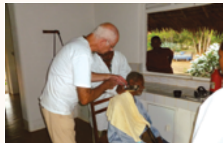
une seringue utilisée en consultation

Créée en 2005, l'association a comme objectif de mener toutes actions contribuant à l'amélioration sanitaire des zones les plus démunies de Madagascar, et en particulier d'accompagner l'installation de jeunes médecins malgaches en brousse et de contribuer au développement des villages concernés.