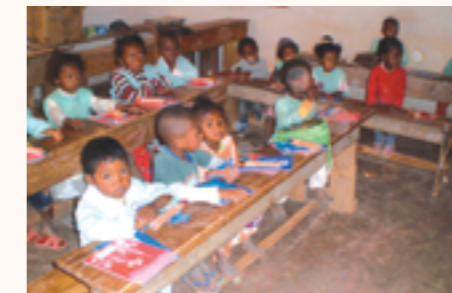
les fournitures scolaires reçues