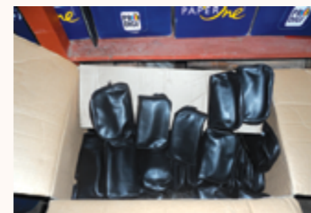
brassards de tensiomètres reçus

Service laboratoire hématologie : mallette de prélèvement, 2 paires de béquilles, seringues, bocal à urine