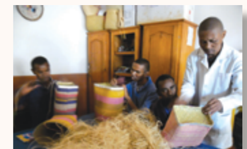
atelier de vannerie