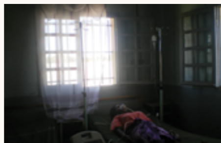
un extracteur d'oxygène en utilisation