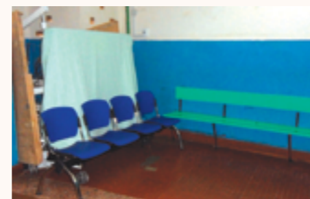
fauteuils installés dans la salle d'attente