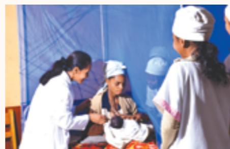
un nouveau-né et sa maman protégés sous une moustiquaire