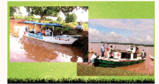
le bateau ambulancier

L'association « Pour que vive Maroala » a commencé ses activités depuis 2007 en agissant principalement pour l'amélioration de la prise en charge sanitaire des quelques 4.000 habitants du village du même nom. Les actions se sont par la suite étendues dans les communes environnantes avec une amplification des objectifs qui se veulent toucher les autres domaines-clés du développement de ces communes, notamment l'éducation.