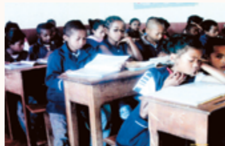
une séance de lecture pour les élèves