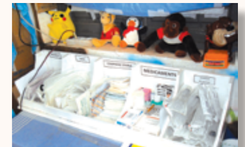
quelques consommables dans la boîte à distribution de médicaments

1 armoire métallique, 1 pèse personne, 2 potences, 1 tensiomètre murale, 2 paires de béquilles, des bocaux à urine, divers consommables