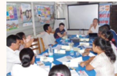
Formation au centre Sisal

En 2015, dans le cadre du renforcement de capacité des jeunes pairs éducateurs qui réalisent les sorties de sensibilisation diurnes et nocturnes auprès des populations à risque, des séances d'information-formation sur l'approche genre et droits des Hommes ayant des relations Sexuels avec des Hommes (HSH) leur ont été dispensées. Par ailleurs 140 personnes ont pu effectuer un dépistage du VIH et environs 16 000 préservatifs ont été distribués. Deux émissions radiophoniques de conférences débats sur la thématique de la santé sexuelle et des droits des enfants ont aussi été diffusées sur Radio Don Bosco.