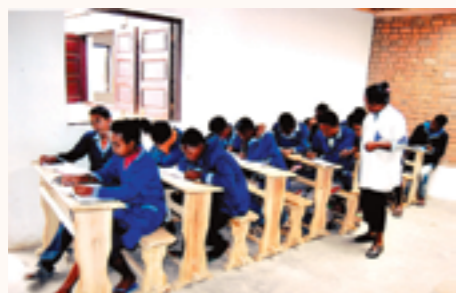
les nouveaux table-bancs