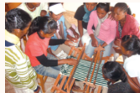
Cours de tissage pour les jeunes filles formées au Foyer Oliva Ulrich d'Antsirabe

Depuis 2013, la Coopération monégasque soutient quatre associations malgaches qui interviennent dans le domaine de l'enfance précaire à Madagascar, et plus particulièrement dans les Hautes-Terres à Fianarantsoa et Antsirabe, ainsi que sur la côte Est à Mananjary.