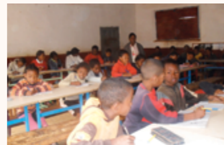
les enfants en classe