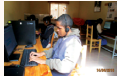
Cours d'informatique pour les élèves non-voyants de Ephata Fianarantsoa

Bénéficiaires : Environ 2 500 enfants et jeunes bénéficiaires des activités des centres partenaires locaux Bel Avenir, Ephata, les Vélos d'Ambalakilonga, le foyer Oliva Ulrich et le centre Fanantenana ainsi que leur personnel.