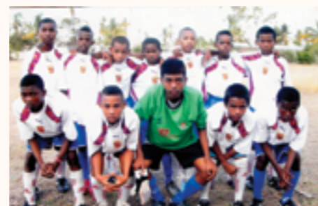
les élèves avec leurs maillots de sport

■ ADS ■ NC ■ N° 61/15 du 09/05/14 et 91/14 du 10/12/14