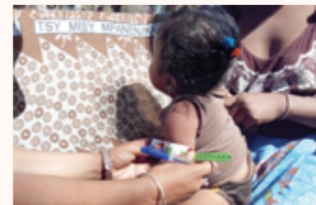
Mesure du périmètre brachial d'un enfant

Au mois de décembre, un avenant au contrat de partenariat et de financement a été signé entre la Principauté et les deux porteurs du projet pour prolonger d'une année la mise en œuvre de MIARO qui devait prendre fin initialement en 2015.