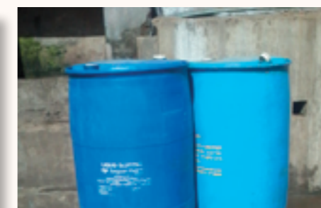
les nouvelles citernes d'eau