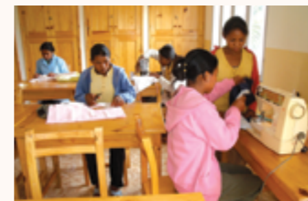
les jeunes filles en plein travaux pratiques

■ ADS ■ NC ■ N° 14/15 et 15/15 du 30/03/15