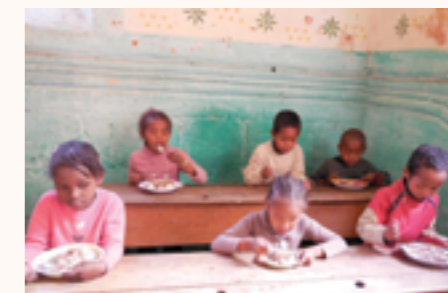
les élèves à la cantine scolaire