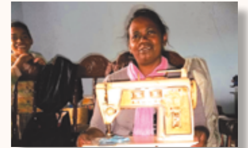
une mère avec sa machine à coudre

En 2015, elle a reçu des machines à coudre, des vêtements et fournitures scolaires.