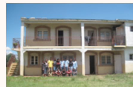
le centre Mirana Tsiky

La contribution financière de 2015 du Consulat a permis de sécuriser le bâtiment du Centre « Mirana Tsiky » et de faire le dallage de la véranda. Le centre accueille 17 enfants et jeunes âgés de 6 à 21 ans, principalement des enfants abandonnés ou dont les parents sont emprisonnés.