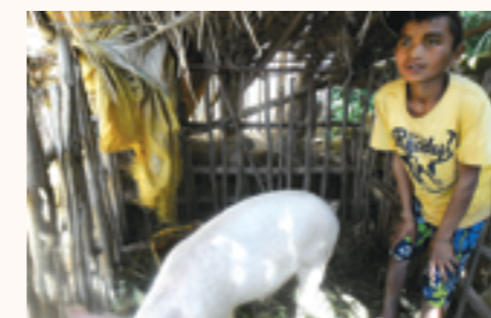
création d'une ferme