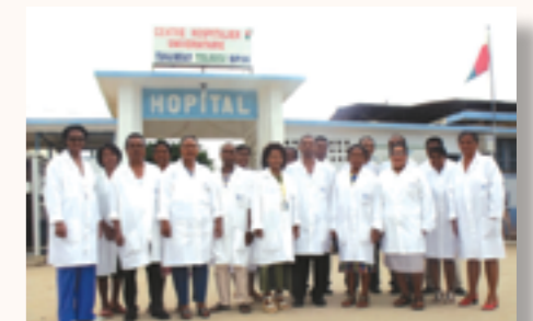
quelques médecins avec leurs blouses