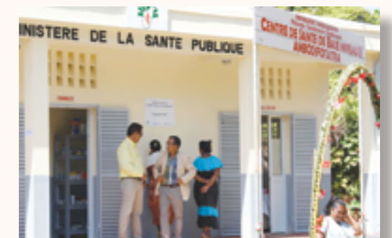
Le CSB II d'Ambohitratra inauguré au mois de septembre 2015

Au mois de septembre 2015, à l'occasion d'une revue conjointe du Ministère de la Santé et des partenaires techniques et financiers du projet, le centre de santé de base urbain niveau 2 de l'île a été inauguré en présence du Secrétaire Général du Ministère de la Santé et de la Représentante de l'OMS.