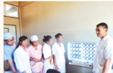
négatoscope pour formation des stagiaires

Service réanimation, urgence, néonatalogie, pneumologie : 1 table alu, 1 pèse personne, 1 pèse bébé, 1 ECG, des biberons, 6 potences, 3 housses de brancard, 1 mannequin de formation d'urgence, 1 machine d'allaitement en douceur, des thermomètres, autres consommables