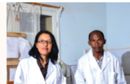
des médecins avec l'électrocardiogramme manuel