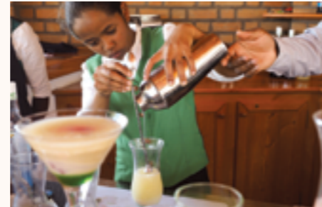
Préparation d'un cocktail par une élève de la filière serveur-barman

L'appui de la Principauté de Monaco, concrétisé par la signature d'un accord de partenariat et de financement au mois d'avril 2015, a pour but de contribuer au développement et à la pérennité de cette initiative. Est prévu entre-autres de consolider le centre de formation professionnelle après sa phase de création (formation pédagogique à destination du personnel, suivi des élèves et insertion dans la vie active, etc.) et d'élargir ses activités, notamment en proposant des formations continues à d'autres bénéficiaires déjà en situation d'embauche.