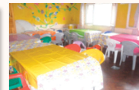
les chaises et tables du réfectoire rénovées