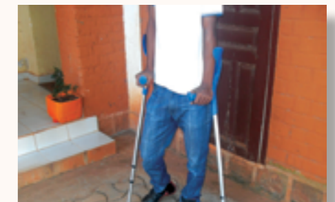
un patient avec ses béquilles