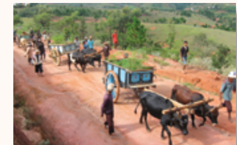
Transports des plants en vue du reboisement