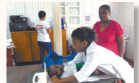
Suivi médical d'un enfant de la cohorte

Après avoir financé la phase pilote de ce Programme entre 2011 et 2013, la Principauté de Monaco poursuit son appui à la mise en œuvre de BIRDY à Madagascar jusqu'en 2017.