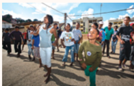
Activité périscolaire au sein d'un centre d'accueil

La Fondation d'Auteuil est un partenaire traditionnel de la Coopération monégasque. A Madagascar, le projet mis en œuvre a pour objectif de réinsérer socialement et économiquement les enfants et jeunes en situation de rue de la capitale. Il vise en particulier à développer et renforcer l'accueil et la prise en charge nutritionnelle, sanitaire et éducative des quatre centres partenaires Energie, Graines de Bitume, Enda-OI et Hardi, en particulier les activités de remise à niveau, de scolarisation, de formation et insertion professionnelle, et les pratiques culturelles et sportives.