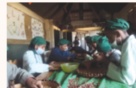
Atelier de confection de beurre de cacahouètes aux Orchidées Blanches

Après près de 10 années de soutien, par le biais du Consulat puis de la Coopération monégasque, le partenariat avec le centre médico-social les Orchidées Blanches a désormais pour objectif d'assurer la pérennisation des actions entreprises et le développement des sources d'autofinancement du centre.