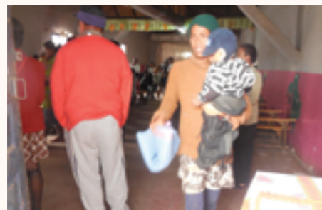
les enfants bénéficiaires des différents quartiers