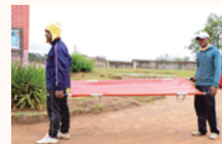
dotation en brancard