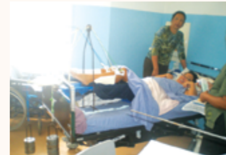
parmi les matériels dotés : le lit et le matelas

Service Neurochirurgie : une console de chirurgie avec écran, chauffe sérum, divers matériels médicaux en neurochirurgie