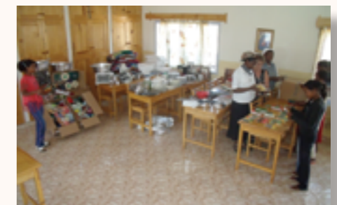
autres équipements remis