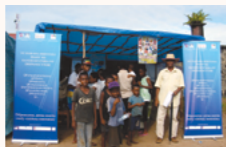
Sensibilisation de la population sur la drépanocytose

Fin 2015, un avenant à la convention entre la coopération monégasque et l'IECD a été signé pour étendre la prise en charge aux enfants de plus de 5 ans et aux adultes dans les régions de mise en œuvre du projet mais aussi à Tamatave, Mahajanga, Mananjary, et Vohipeno.