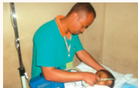
potence en utilisation