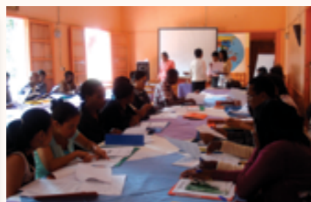
les éducateurs et personnels en formation