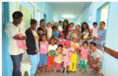
Enfants bénéficiaires du projet

Bénéficiaires : Les enfants atteints de cardiopathies congénitales, le personnel soignant des centres de santé de base en région