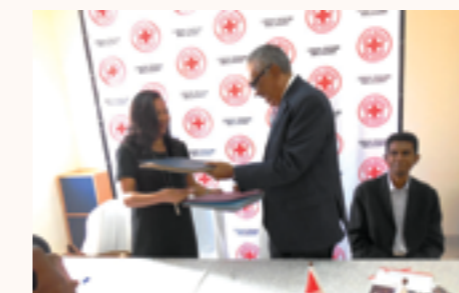
le Président de la Croix Rouge Malagasy et le Vice-Consul de Monaco lors de la signature de convention

La Croix Rouge Malagasy, quant à elle, est une association de secours volontaire a pour mission de contribuer à l'amélioration des conditions d'existence des plus vulnérables en apportant son soutien dans les domaines de la santé, de la gestion des risques et des catastrophes, de la réduction des risques, de la santé communautaire ainsi que la promotion des principes et valeurs humanitaires.