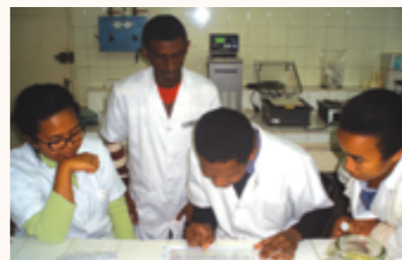
L'équipe d'hématologie de l'HJRA