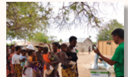
Distribution de Nutributter aux mamans bénéficiaires du projet