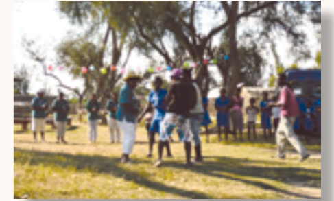
grand camp à Isalo

Ces jeunes ont pu s'épanouir dans diverses activités lors de ce séjour : visites du parc national de l'Isalo, découvertes dans les plages et dans les villages aux alentours de Tuléar, échanges avec les jeunes villageois et les habitants.