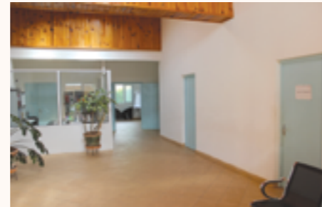
Le centre national de lutte contre le paludisme

Depuis 2013, la Principauté de Monaco s'est engagée à assurer le financement de l'entretien et la maintenance de ce bâtiment. La subvention de la Coopération Internationale permet entre autres de prendre en charge les salaires des personnels non fonctionnaires, les frais de Jirama, d'entretien et de sécurité du bâtiment, l'achat de fournitures ou encore la maintenance du matériel informatique.