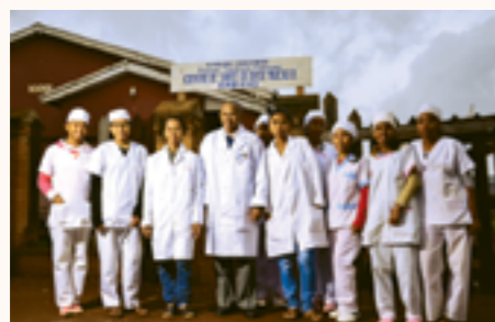
les blouses des médecins