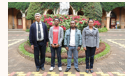
les Directeurs de l'ESCA Antanimena et du Collège Saint Michel avec les parents et élèves bénéficiaires