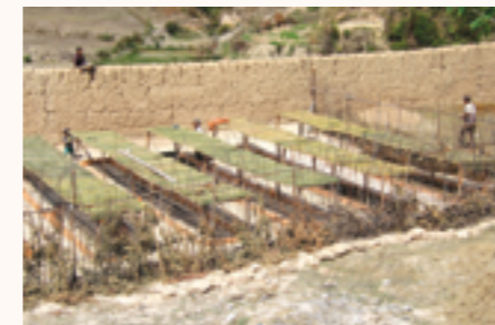
Construction des pépinières

En partenariat avec l'ONG malgache Lalona, Zébutnet renforce les pratiques avicoles de 50 éleveurs en les accompagnant financièrement et techniquement pour la construction de poulaillers dans la région d'Ambatolampy. En parallèle, des activités de reboisement sont entreprises sur les terres communales d'Andriambilany. Près de 28 000 plants doivent être plantés dans les 9 fokontany de la commune. Des pépiniéristes seront formés dans chaque quartier pour assurer la pérennité de cette action. Les plants choisis seront diversifiés et auront différentes propriétés afin de reboiser la commune de manière durable (plants aux vertus médicinales, bois de construction, fixation de talus, arbres fruitiers, etc.).