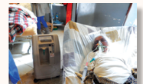
un extracteur d'oxygène en utilisation